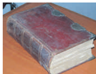
'n State-Generale Bybel met die inskrywing “Philip Hendrik Morkel, 13 Feb 1820” (die inwydingsdatum) het behoue gebly.