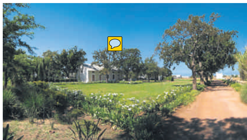
'n Onlangse foto van hoe die historiese kerk vandag lyk.