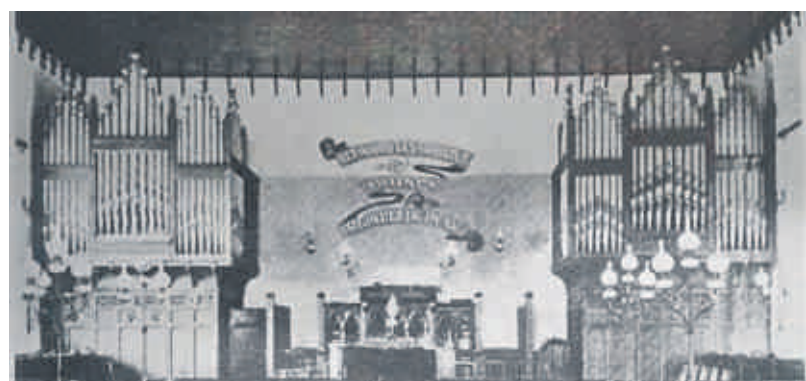
Die orrel in die ou kerk.

Hulle het 'n gedeelte van die plaas Cloetenburg gekoop en toestemming by Lord Charles Somerset, toe goewerneur aan die Kaap, gekry om 'n kerk te bou en erwe te verkoop. 'n Veiling vir 100 erwe is in Julie 1817 rondom die beplande kerkterrein gehou. Lord Charles het toestemming verleen dat die nuwe dorp